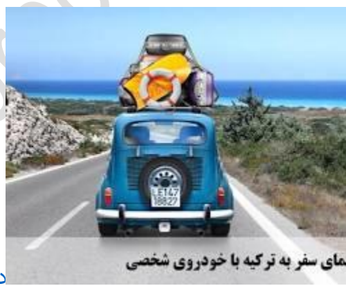
نمای سفر به ترکیه با خودروی شخصی

مسیر پیشنهادی برای سفر از ایران به اروپا با خودرو شخصی از طریق ترکیه و یونان است. این مسیر به دلیل کوتاه‌تر بودن و امنیت بیشتر، نسبت به سایر مسیرها ترجیح داده می‌شود.